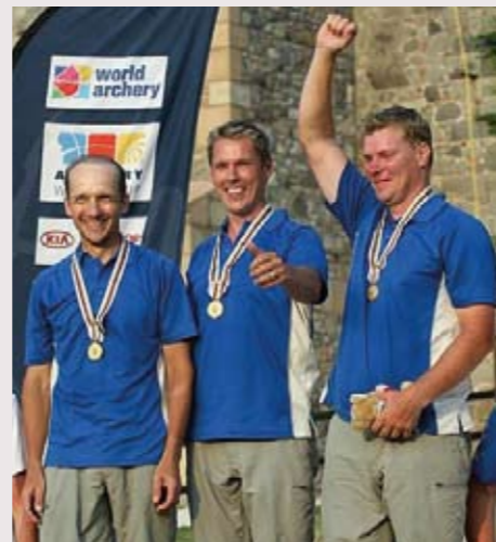
Miesten voitokas joukkue iloitsi korkeimmalla palkintokorokkeella.