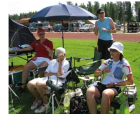
Helletä piisasi, mittari taisi kivuta +30° paremmalle puolelle molempina päivinä.

Järjestelyt ovat täydessä vauhdissa ja huikeita suunnitelmia on luvassa. Aika näyttää miten suunnitelmat toteutuvat.