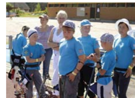
Viron junnut osallistuivat joukolla kisaan, aikuiset pääsivät huoltojoukoissa mukaan.

Vuoden 2011 Kymi Archery Open tullaan järjestämään suurin piirtein samalla konseptilla. Me kisajärjestäjät olemme varautuneet huomattavasti suurempaan kilpailijamäärään. Ammuntakenttään tehdään tarvittavat muutokset, jolloin juniorit saattavat ampua samanlaisesti viereisellä kentällä omaa kilpailuaan.