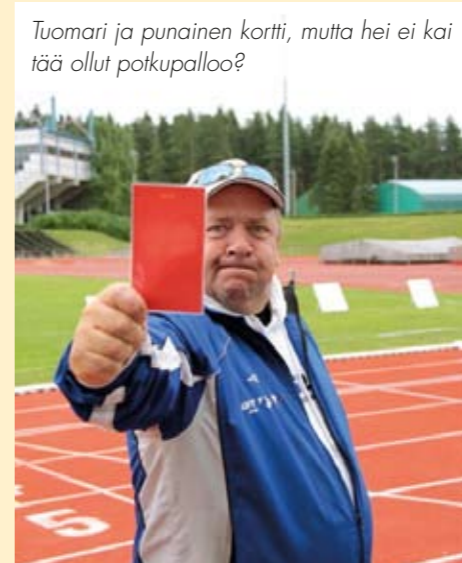
Tuomari ja punainen kortti, mutta hei ei kai täällä ollut potkupalloa?