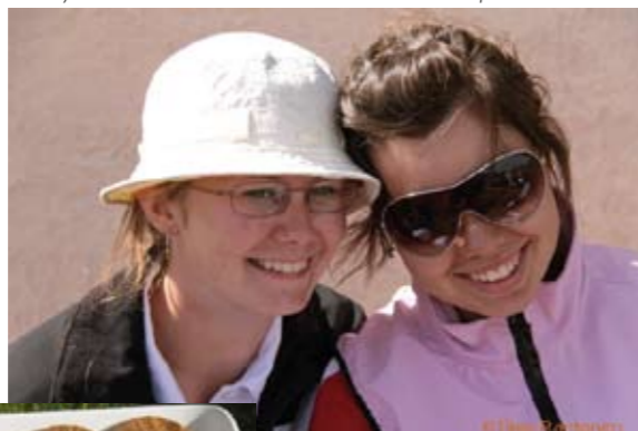
20 tähtäinjoukkuetta oli mukana kisassa, ja Diana57 vei voiton kurikkalaisten tullessa tällä kertaa toiseksi ja Tapanilan Erän kolmanneksi