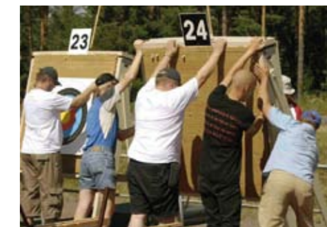
Auringon pahtamia taustoja jouduttiin välillä vaihtamaan, jotteivät nuolet sujahtelisi läpi.